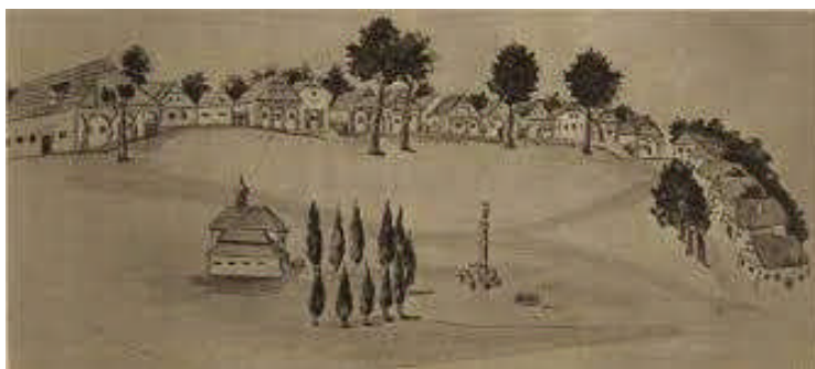
Miletín náměstí (1825), Erben je 14-ti letý gymnasista

Mezi nejznamenitější rodáky miletínské patří bezesporu sběratel lidové slovesnosti, básník, historik a archivář Karel Jaromír Erben.